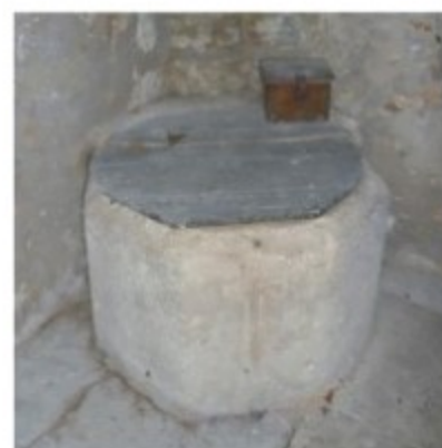
Cuve baptismale XIIe

Parmi les objets saints, on peut admirer sur un pilier roman de la travée de chœur, un Christ en bois du XVII ème siècle.