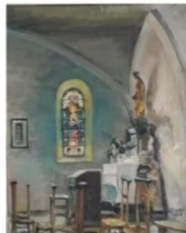
Chapelle Notre Dame - huile de Joseph Duss évacué alsacien- 1940

Des arceaux et des fenêtres sont de forme romane ou ogivale, peu accentuée.