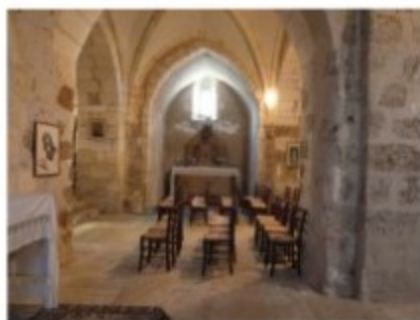
Travée de chœur, photo prise de la chapelle Notre Dame

Quand on pénètre dans l'édifice, on a en face de soi une nef à deux travées, voûtée, en pierre de taille, suivie d'une travée de chœur et d'un chœur. La travée de chœur carrée avec d'énormes piliers à chaque angle, témoigne de son passé roman ; il est probable qu'elle était surmontée d'une coupole.