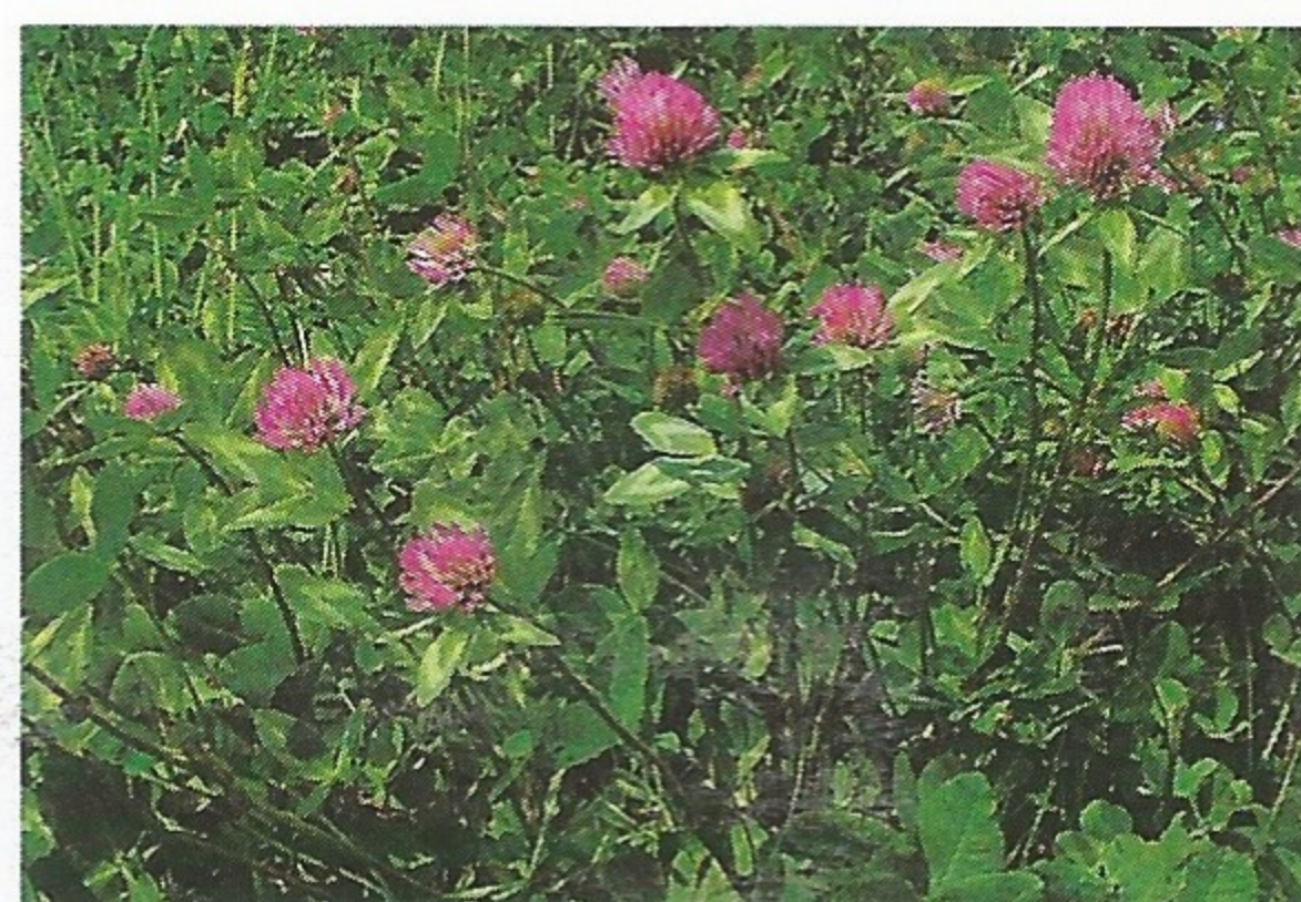
Trèfle des prés