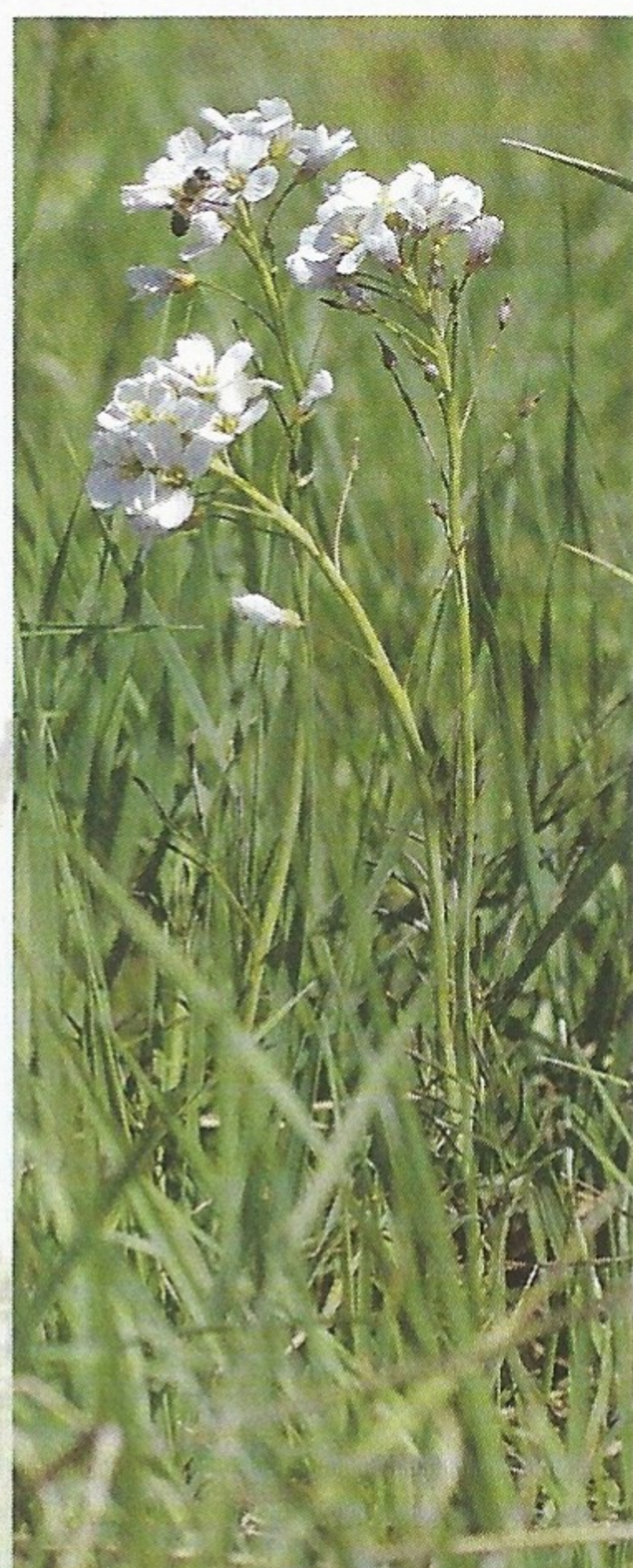
Cardamine des prés