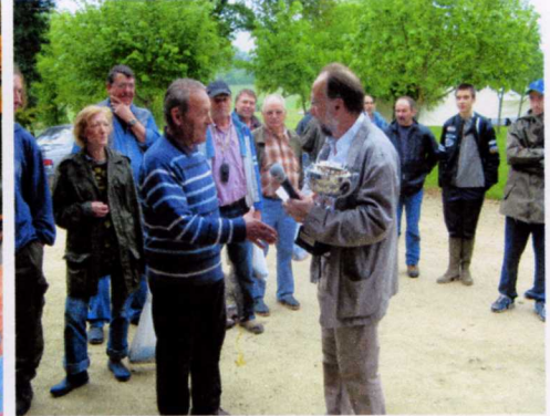
Félicitations au gagnant de la pêche