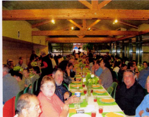
Un repas apprécié